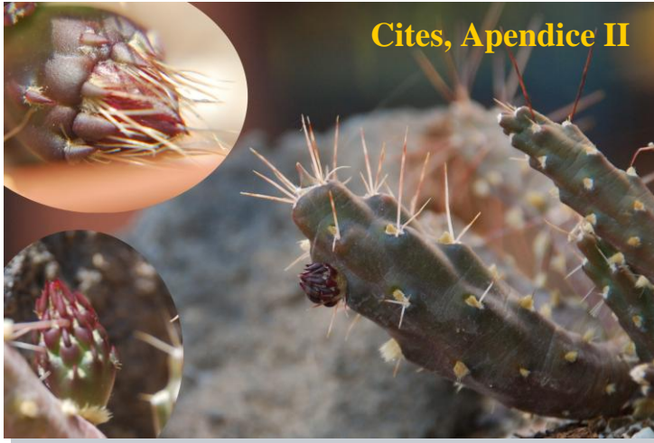
Cites, Apendice II

Según el criterio de D. Hunt es: Tephrocactus nigrispinus (K. Schumann) Backeberg 1935