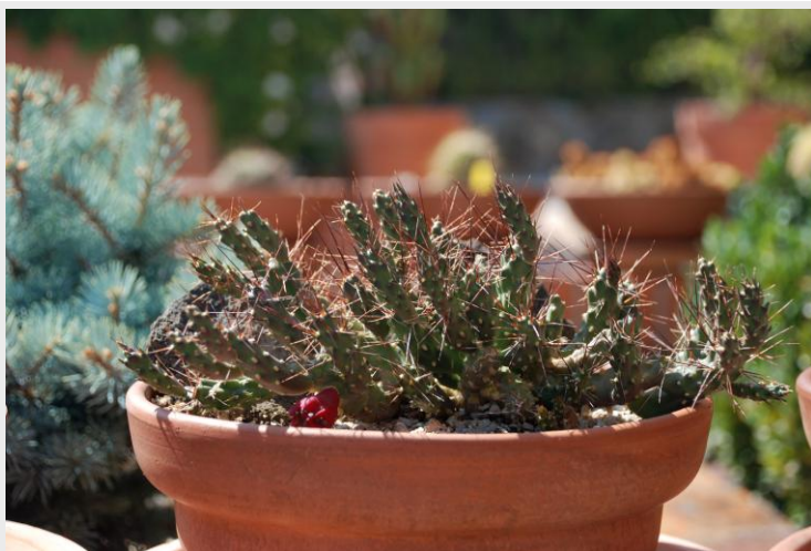
Otra vista general