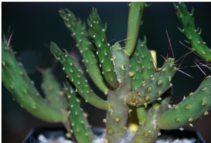
Cultivada bajo falta de luz, luce de color verde oscuro y algo elongada

Vista aérea donde se ve el estigma de color morado.