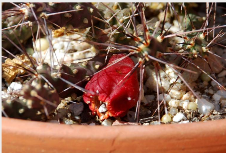
Detalle del fruto.