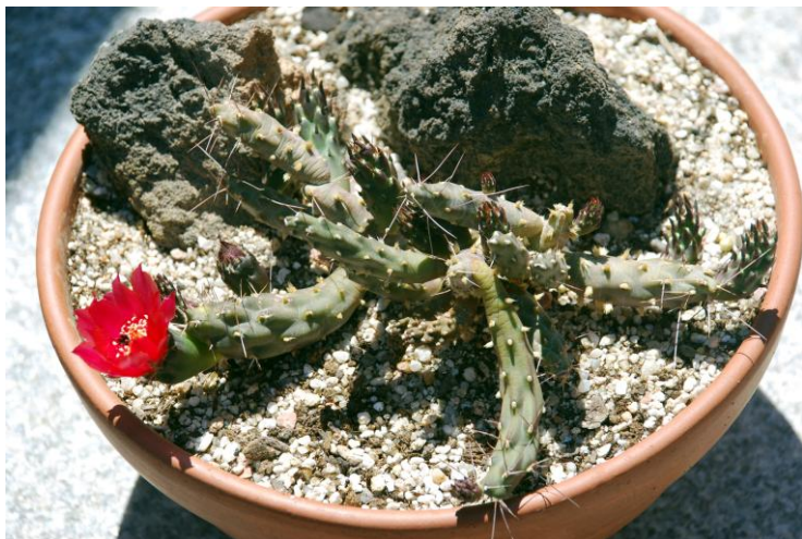
Vista aérea de la planta

Detalle de la flor, con un color rojo-purpura muy intenso