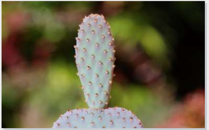
Segmento en crecimiento.